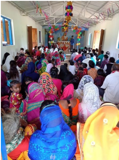
Kirche in Badopathar, im Oktober 2020 eingeweiht

Der Eine-Welt-Kreis St. Gertrud, i.A. Otmar Kolb